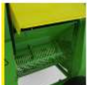
Ürün soyma kiti