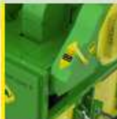
Son temizlik kiti

H 2200 is built to harvest product in any geographic condition with vacuuming system, it needs minimum 45hp tractor to work properly. It can clean up the product and put the loaded ones in the sack %100, which we called husking. It can harvest around two to three tonnes a day. Also if you use one vacuum hose you can collect at 70 to 80 meters very easily and it can work in any kind of sloping landscape (if you can climb there H 2200 can harvest there).