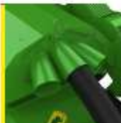
3 hortumlu sistem